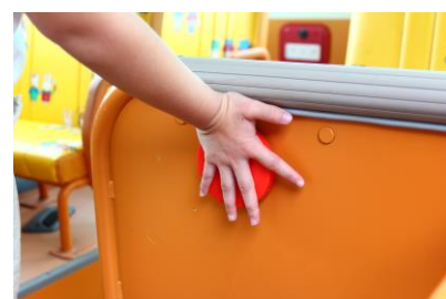
(図4) SOS ボタン