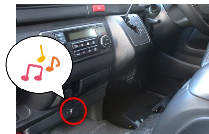
(図1) メロディスピーカー

※ 後部ボタンを押さずに車から離れた場合は、クラクションを断続的に鳴らして警告します。